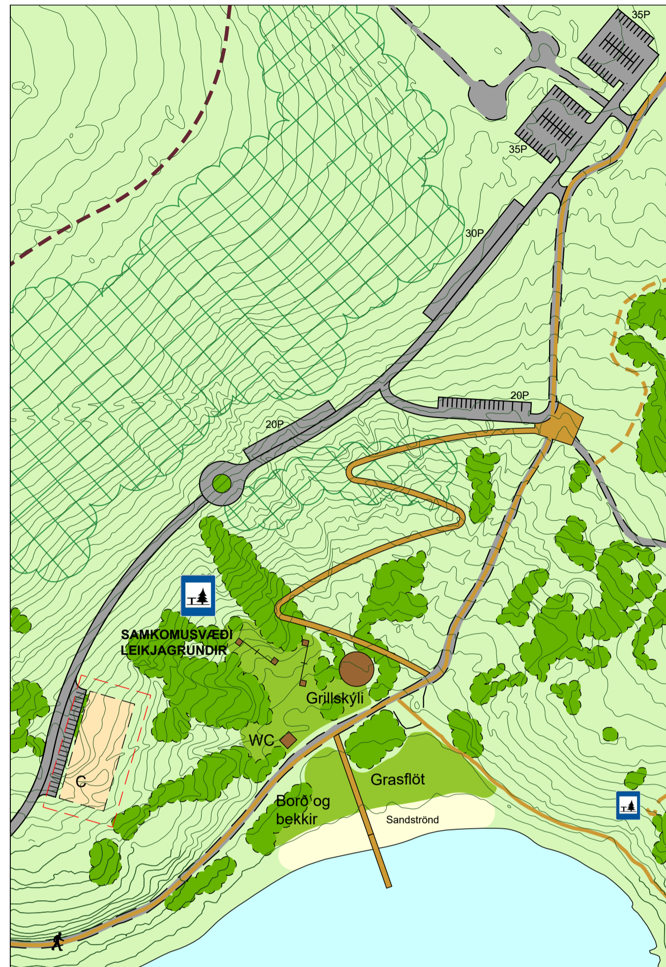
BREYTT DEILISKIPULAG REITUR 2 - ÁNINGARSTAÐUR OG LEIKJAGRUNDIR VIÐ NORDANVERT HVALEYRRVATN