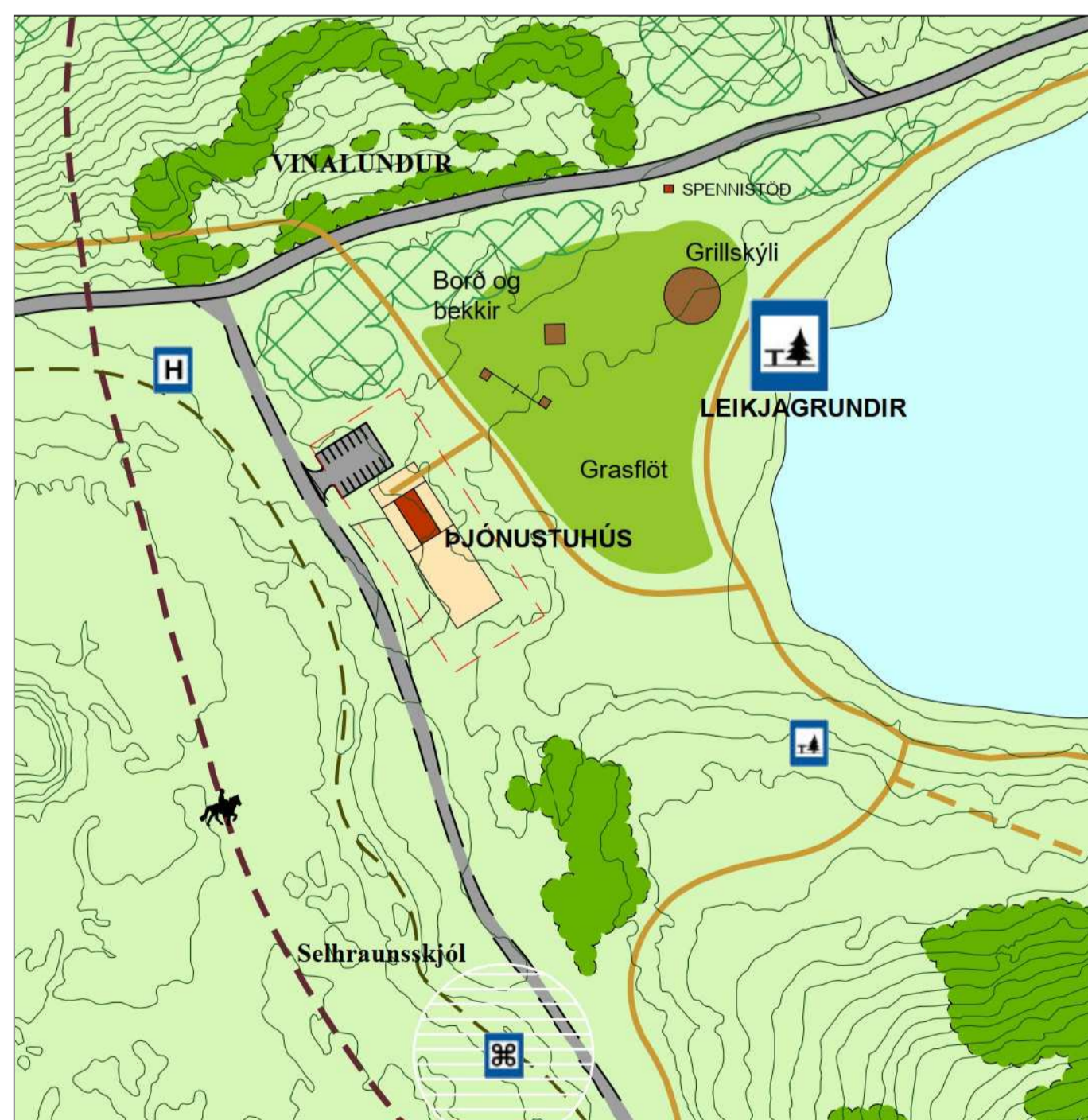
GILDANDI DEILISKIPULAG REITUR 3 - ÞJÓNUSTUHÚS OG LEIKJAGRUNDIR VIÐ VESTURENDA HVALEYRRVATNS