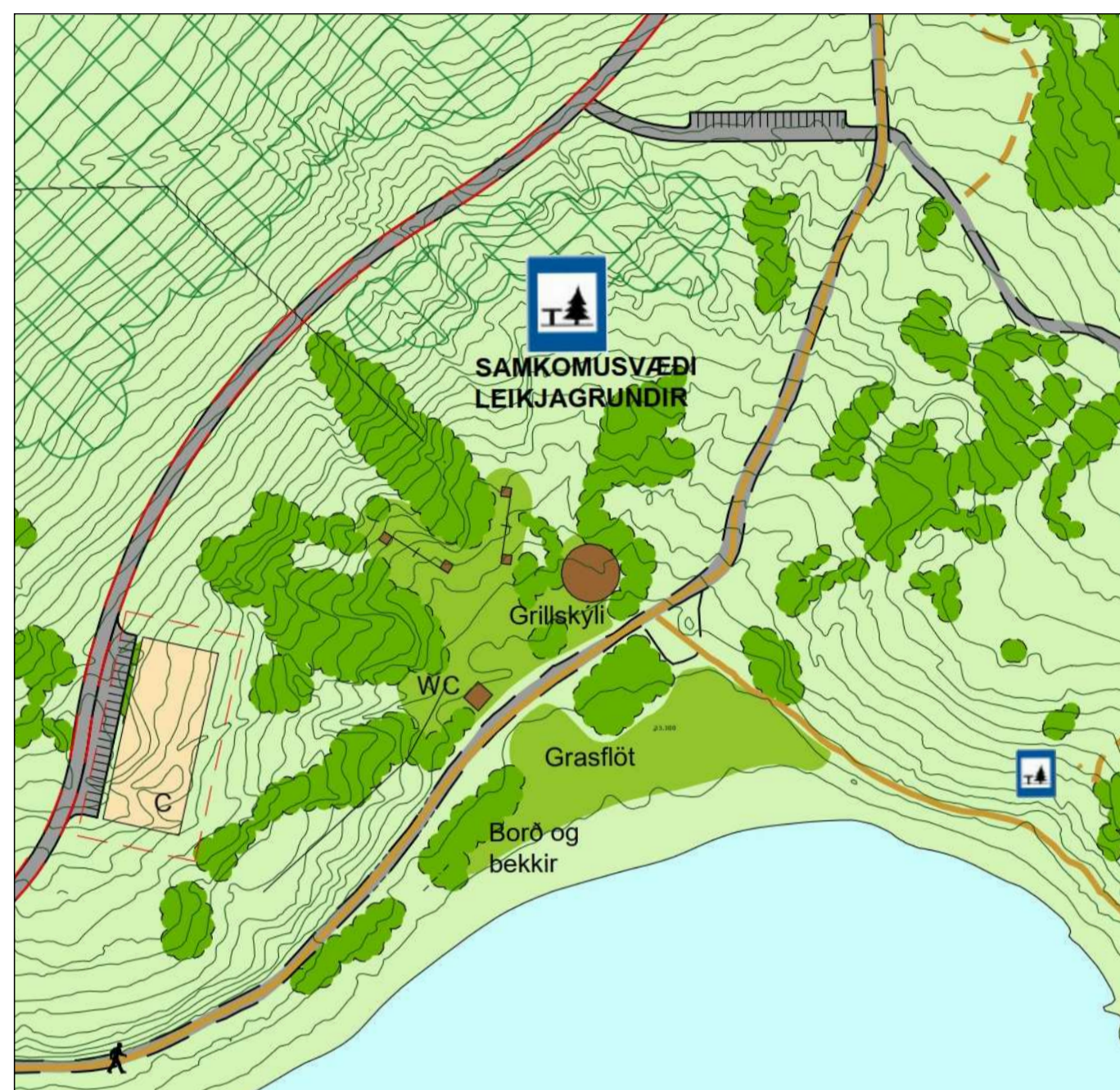
GILDANDI DEILISKIPULAG REITUR 2 - ÁNINGARSTAÐUR OG LEIKJAGRUNDIR VIÐ NORDANVERT HVALEYRRVATN