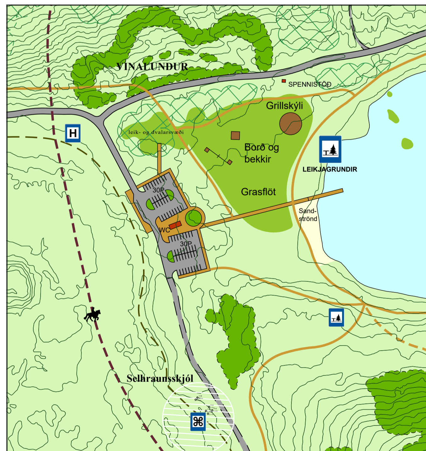
BREYTT DEILISKIPULAG REITUR 3 - ÞJÓNUSTUHÚS OG LEIKJAGRUNDIR VIÐ VESTURENDA HVALEYRRVATNS